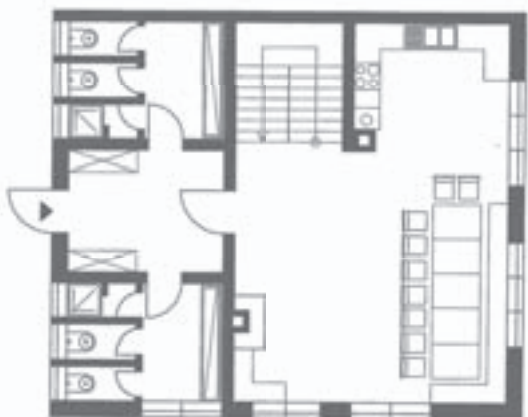
Zeichnung: Peter Klumpp (Moppl)