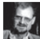
Roland Roland Kaiser