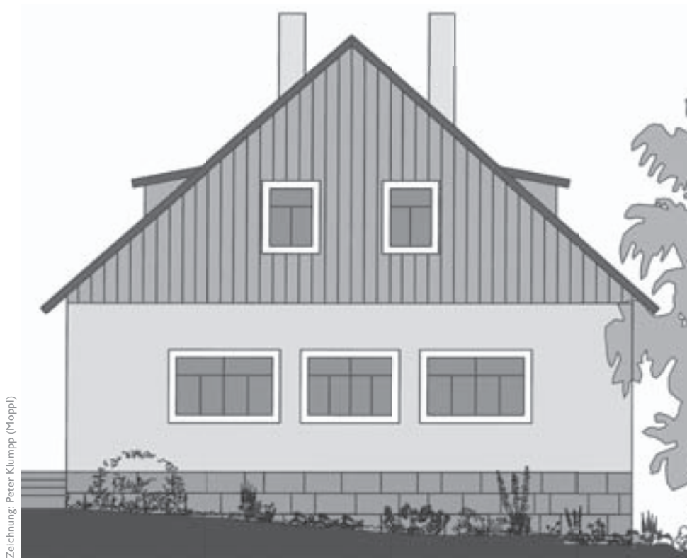
Zeichnung: Peter Klumpp (Mopp)

Bei der äußerlichen Gestaltung der Kleinen Scheune orientierten wir uns